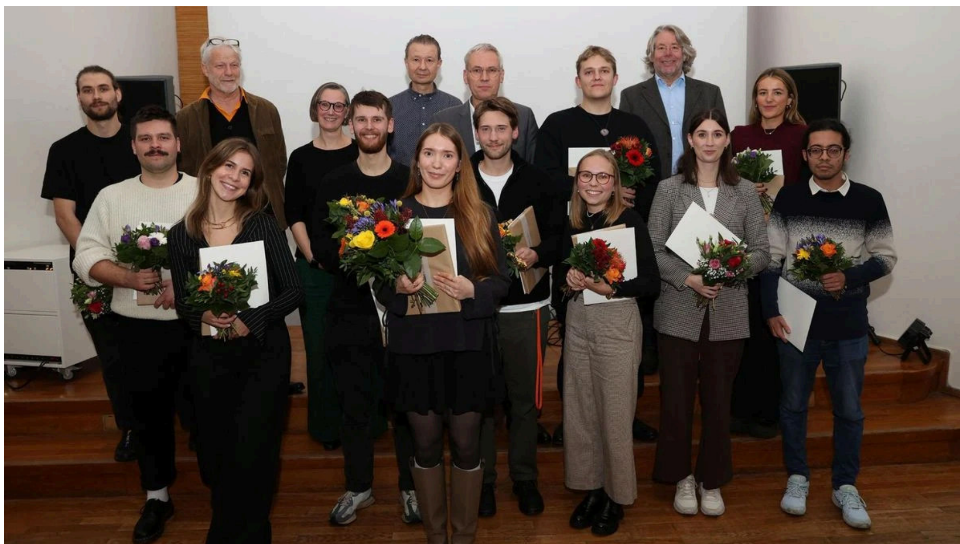
Die Sieger und Platzierten des 14. „Wolfsburg Award for urban vision“ der Stadt Wolfsburg.

Von Stephanie Giesecke Redakteurin Wolfsburg